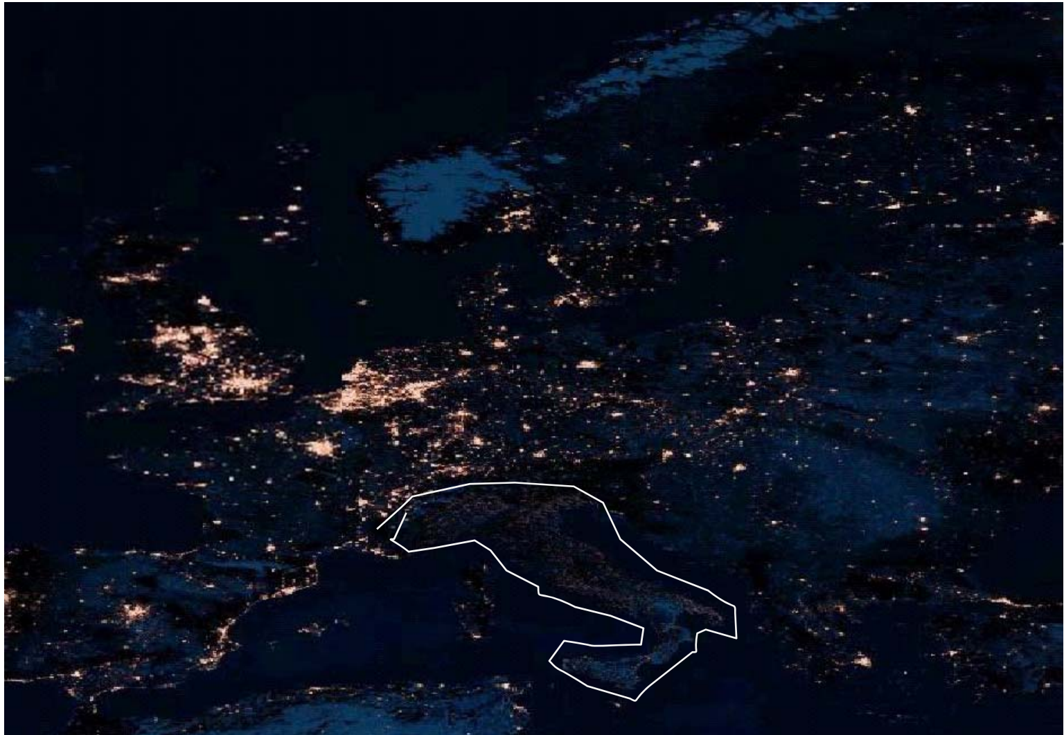
System breakdown in Italy sept 2003

And inspite of all new demands, the system stability and reliability is expected to increase.